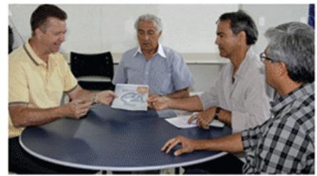
Candidatos a Governador do Distrito Federal recebem propostas para fortalecimento do BRB